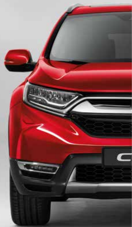
METALICKÁ PREMIUM CRYSTAL RED*

Každá farba je výsledkom úsilia o dokonalý štýl modelu CR-V. Stačí si už len vybrať svoju obľúbenú.