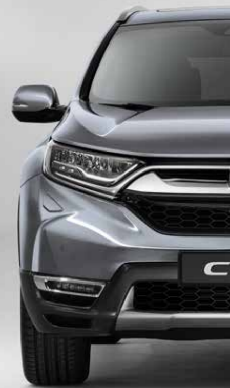
METALICKÁ LUNAR SILVER