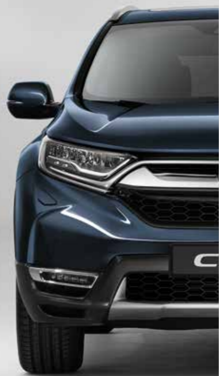
METALICKÁ COSMIC BLUE