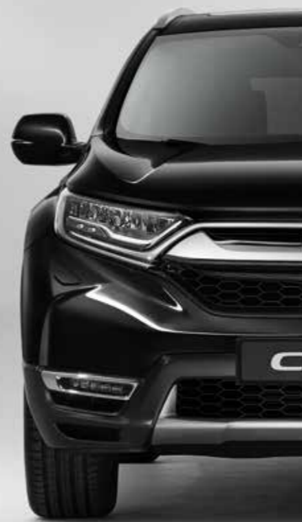
PERLEŤOVÁ CRYSTAL BLACK