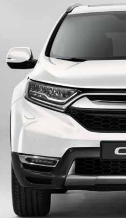
PERLEŤOVÁ PLATINUM WHITE