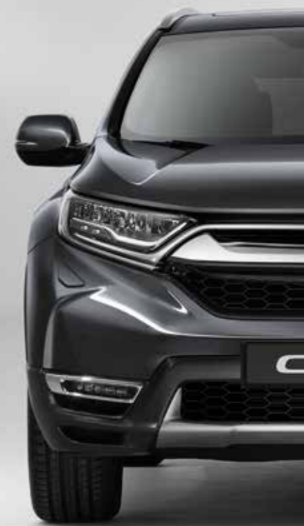
METALICKÁ MODERN STEEL