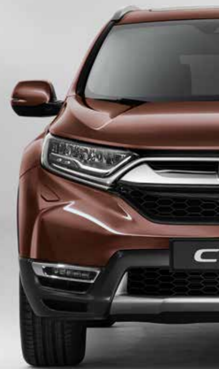
PERLEŤOVÁ PREMIUM AGATE BROWN