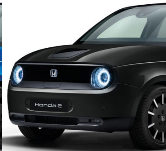
PERLEŤOVÁ CRYSTAL BLACK