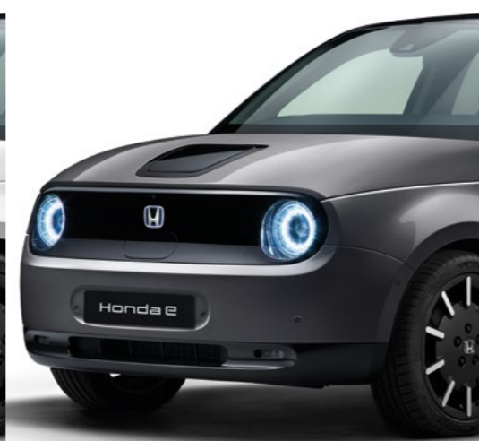
METALICKÁ MODERN STEEL