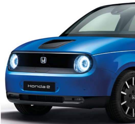
PRÉMIOVÁ METALICKÁ CRYSTAL BLUE