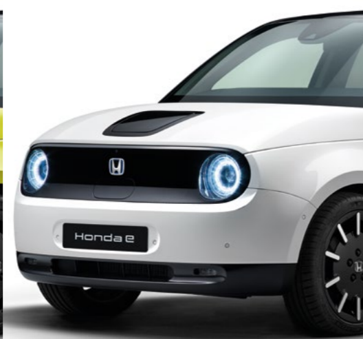
PERLEŤOVÁ PLATINUM WHITE